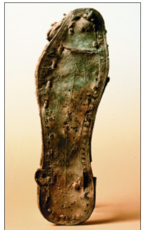
Sandalensohle, um Christi Geburt. Solche Sandalen wurden auch in Masada und in der sogenannten Höhle der Briefe gefunden.

Die Siedlung Qumran wurde um 130 vor Chr. gegründet. Die Essener wohnten dort bis 68 nach Christus, als das Dorf zerstört wurde. Sie führten ein Klosterleben, das überwiegend durch Studium, Andachten, Gebete und Arbeit ausgefüllt war. Die Gründung der Bewegung der Essener können wir der schwierigen politischen und kulturellen Situation der Juden um diese Zeit zuschreiben. Sie fühlten sich bedroht von der zunehmenden